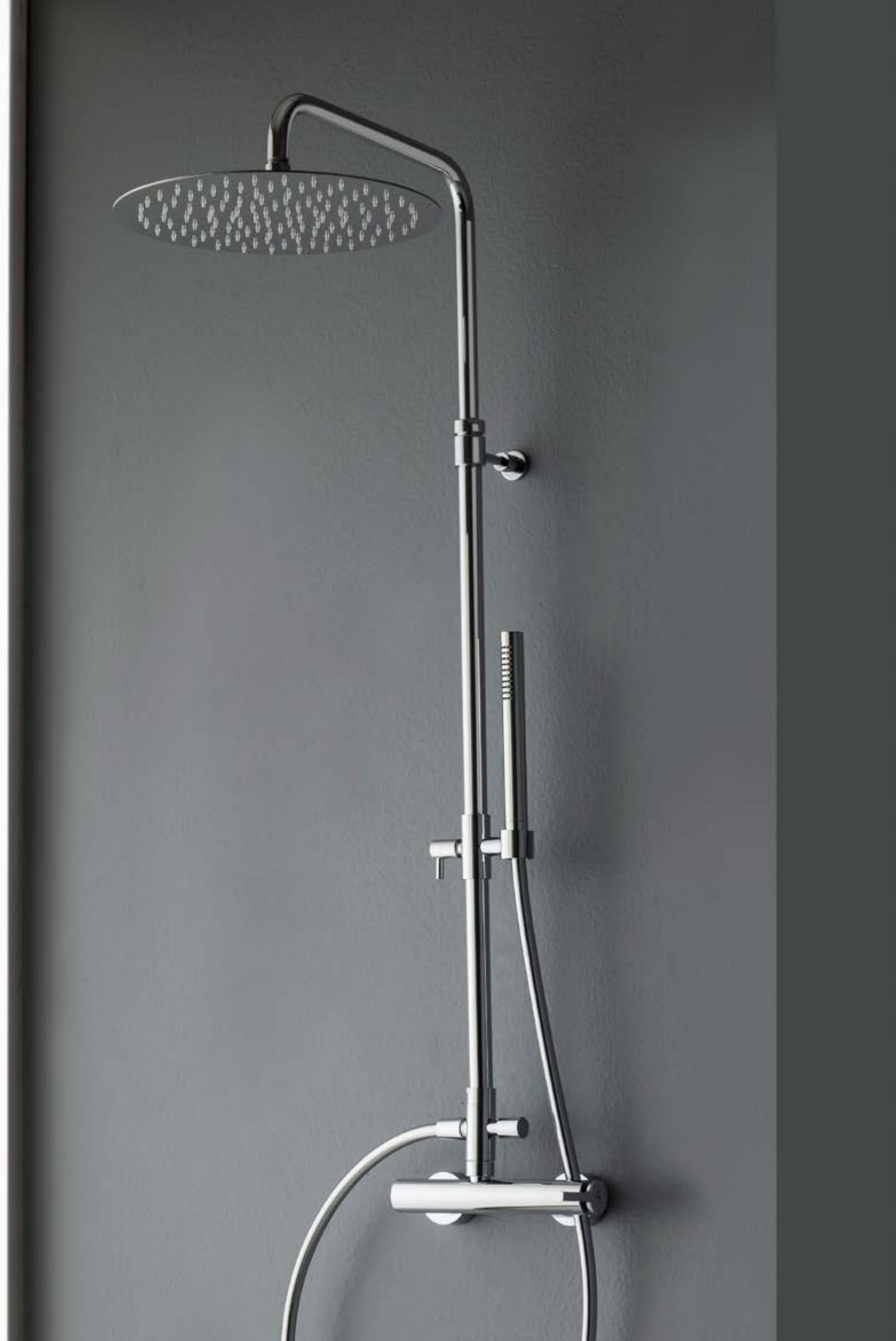
IT 5160 CC TM ZZ