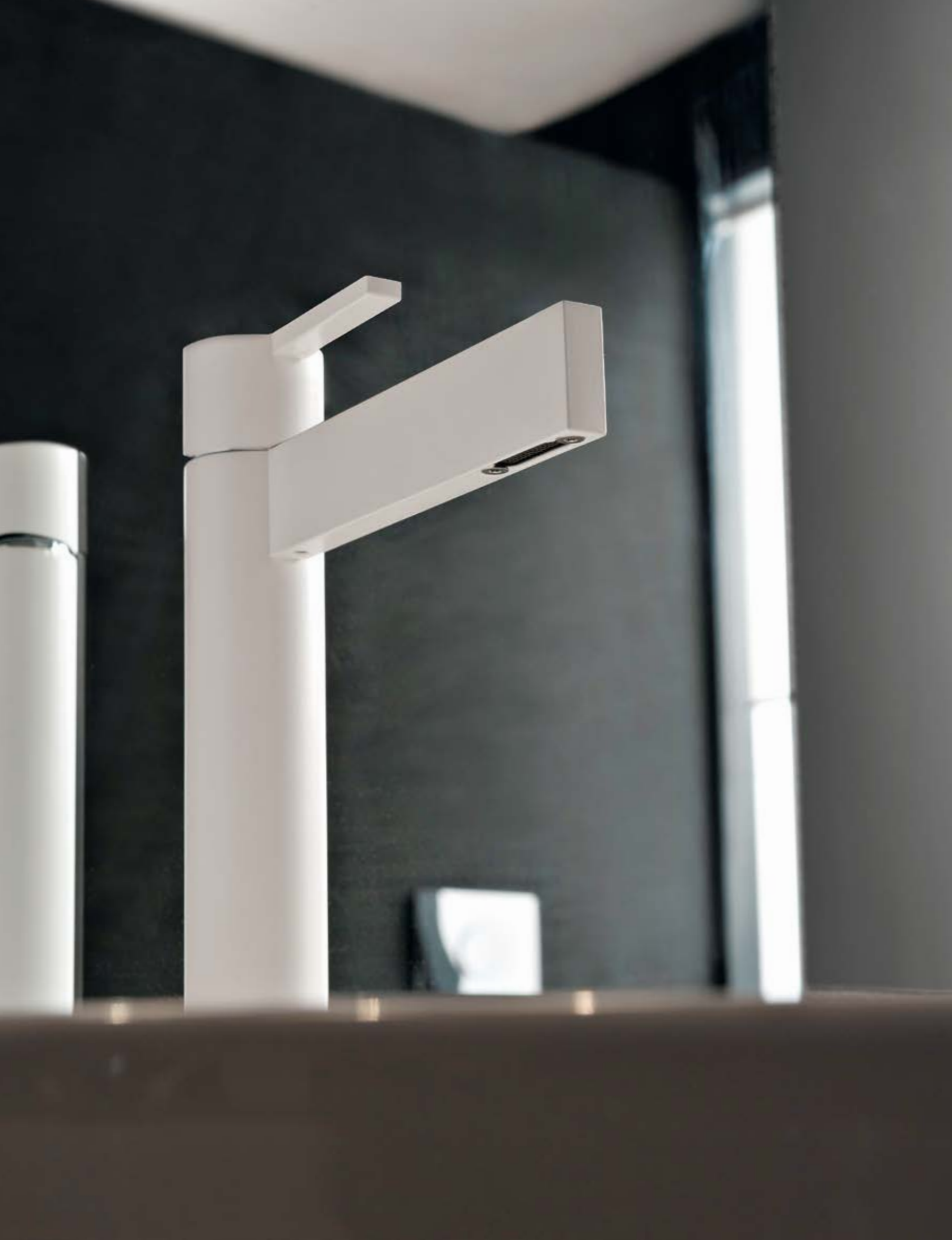
IT 5111 BB TL ZZ