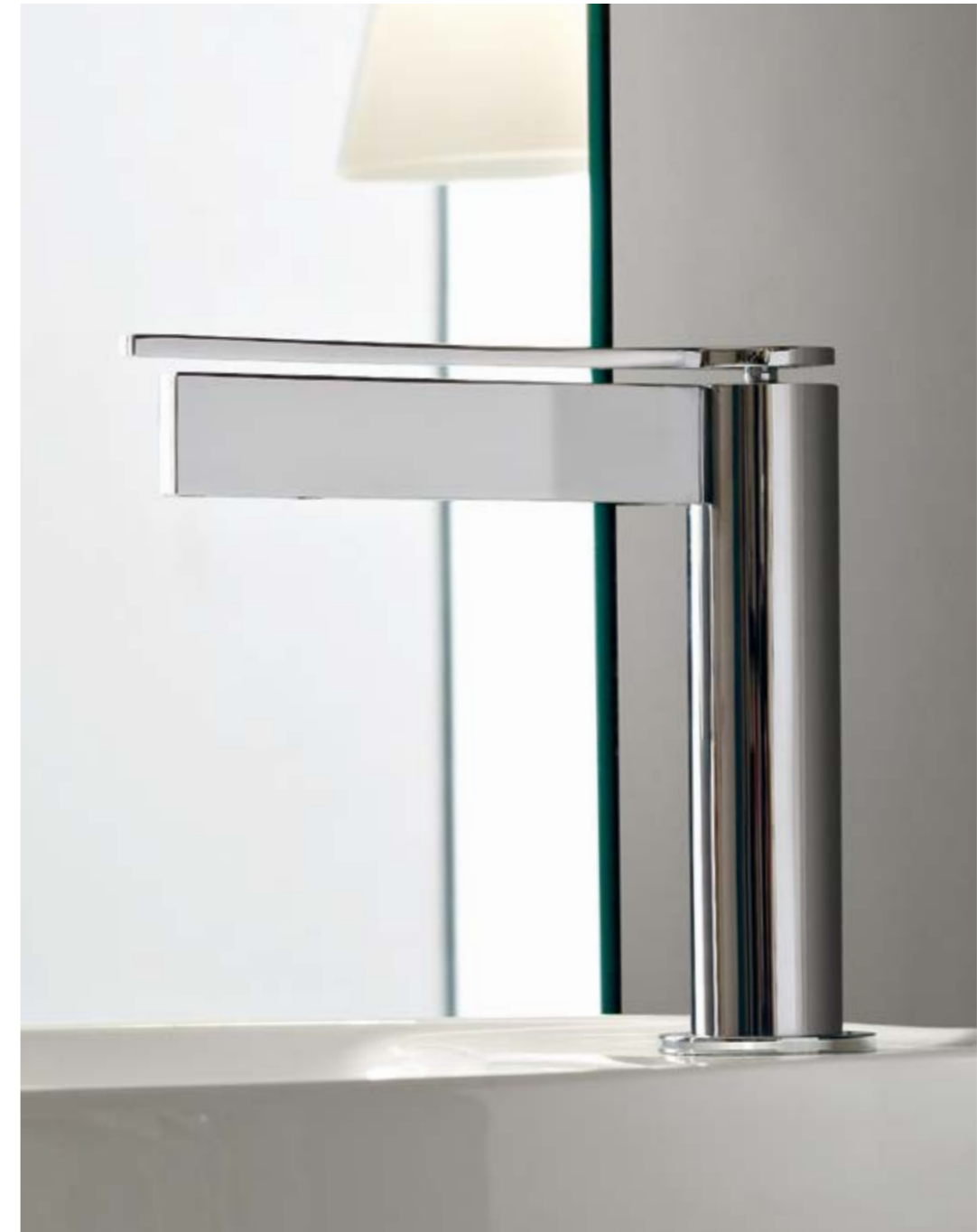
IT 5111 CC TM ZZ